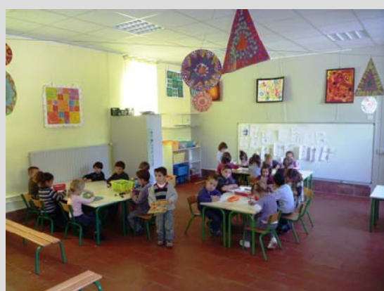
Classe de Mme ROZES