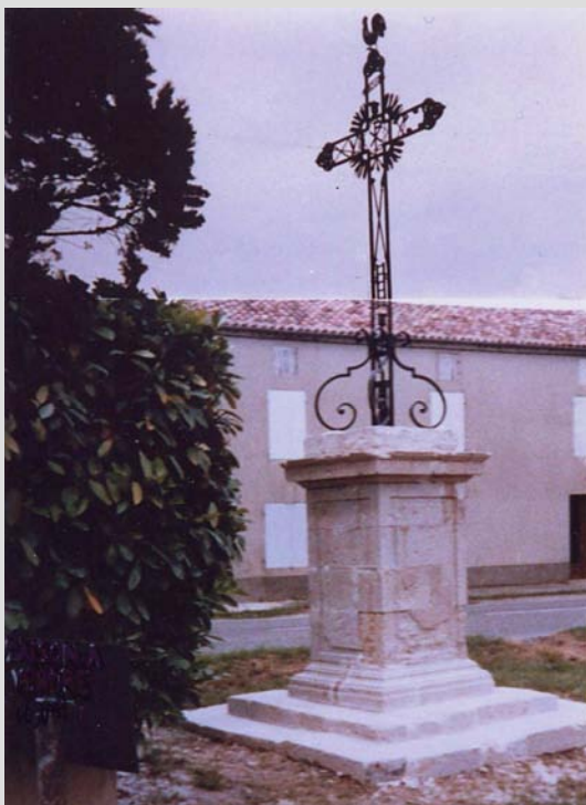
La croix avant la tempête