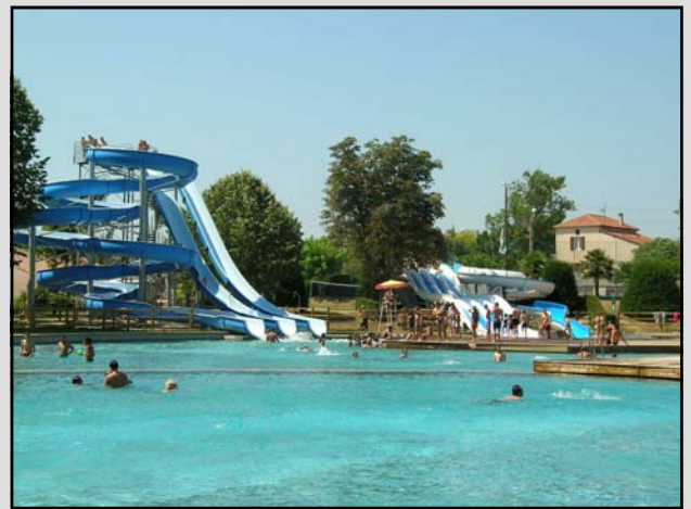
Parc de loisirs